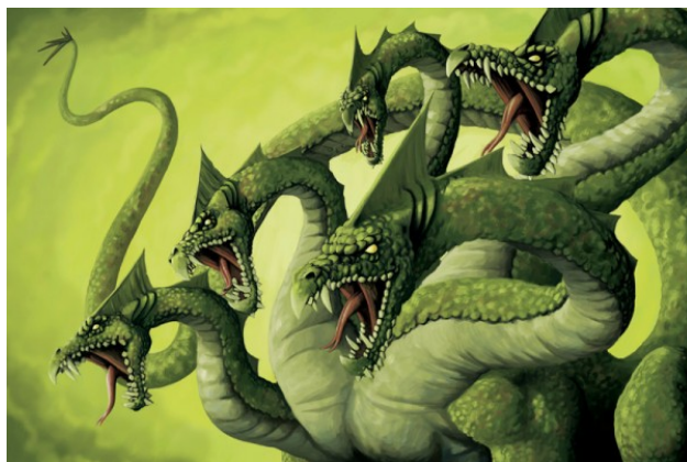
Quái vật Hydra

5- Tổng Thống Thomas Jefferson (1801-1809) vị T.T. thứ ba của Mỹ thấy cái nguy hại cho đất nước và gọi liên đoàn các nhà bank [the banking cartel] là “một con quái vật ăn thịt người có cái đầu của con hydra” và Ông nói rằng “Nếu dân Mỹ để cho nhà bank kiểm soát việc phát hành tiền tệ của mình, thì trước hết bằng sự lạm phát [inflation] rồi bằng sự kém phát [deflation] các nhà bank và các công ty [corporations] sẽ phát triển và tước đoạt hết tài sản của dân, thì con cháu chúng ta sẽ thức dậy vô gia-cư, trên cái lục địa mà cha mẹ của chúng đã chiếm được.” Nên năm 1811 Congress không chấp nhận tái ban cho đặc quyền [renew the charter] cho First U.S. Bank. Thì chiến tranh với Anh quốc [the War of 1812] bùng nổ. Chiến tranh đưa quốc gia đến sự lạm phát [inflation] và nợ nần [debt]. Vì những lý do đó, Tổng Thống James Madison (1809-1817) vị T.T. thứ tư của Mỹ, phải ký một đặc quyền 20 năm [a twenty year charter] cho Second Bank of The United States vào năm 1816.