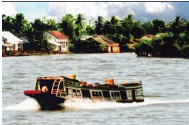
Xóm nhà ven sông, xa xa chiếc tàu đò là hình ảnh quen thuộc của nông thôn miền Nam