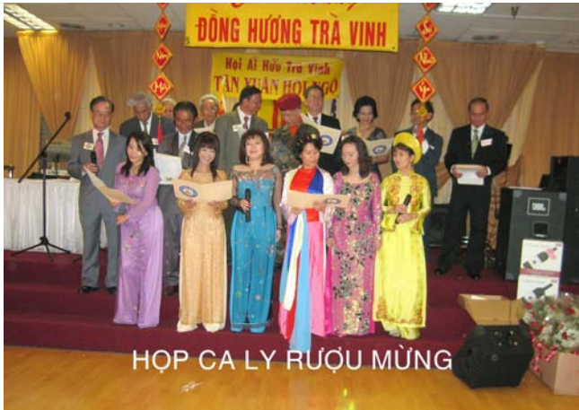
Ban Hợp Ca Ly Rượu Mừng

Tết cho nhau nhiều câu tốt đẹp. Trên nét mặt mọi người đều vui tươi hứa hẹn cho một năm mới được tràn đầy An Khang, Hạnh Phúc, Trước khi chia tay mọi người đều hứa hẹn sẽ gặp nhau vào ngày Hạp Hè. Được biết năm nào Hội Trà Vinh cũng tổ chức Hạp Hè để các đồng hương có dịp sinh hoạt ngoài trời và hàn huyên tâm sự tại Mile Square Park vào tháng 7 dl hằng năm.