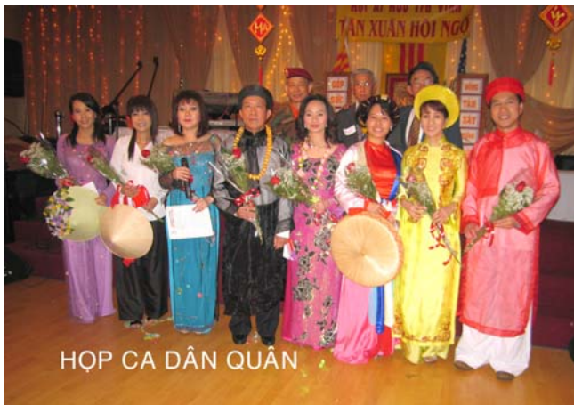
Dân Quân mừng Xuân hạnh phúc