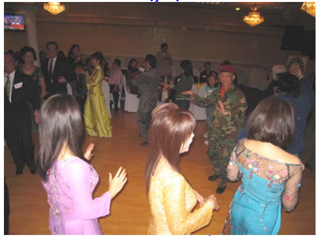
Hoạt cảnh 'Lâm thôn' sống động