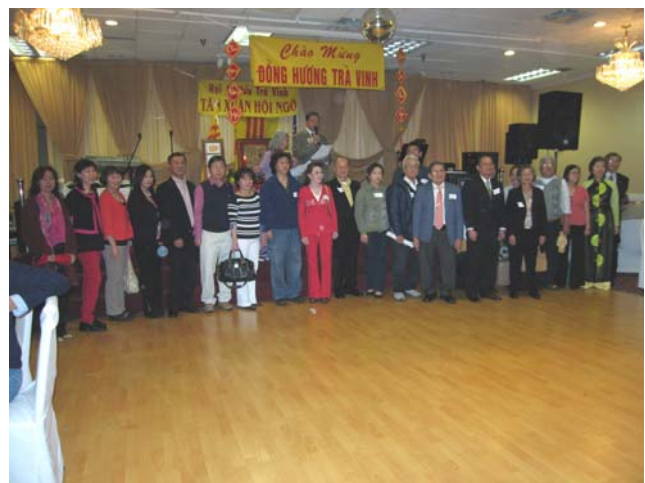
Các Đồng Hương từ xa về hội ngộ