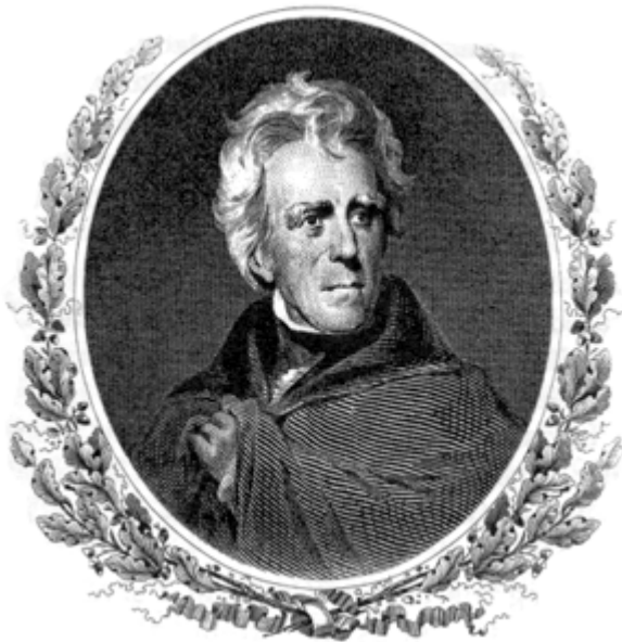
President Andrew Jackson 1767 – 1845

nói: “Con hydra của sự đòi bại mới bị chặn lại chớ chưa chết”. Ông ra lệnh cho Ông Tổng Trưởng Tài Chánh [Treasury Secretary] mới của Ông chuyển hết tiền deposits của chánh phủ từ Second US Bank qua các nhà bank của Tiểu Bang [state banks] thì ông này từ chối không làm. Ông T.T. cách chức ông ấy, và bổ nhiệm một người khác Ông này cũng từ chối không làm thì T.T. Jackson bổ nhiệm người thứ ba, Ông này thi hành lệnh nên T.T. Jackson vui mừng mà nói: “Tôi đã trói được con quái vật rồi” Nhưng ông chủ nhà Bank, lobby được Senate không chấp thuận người được Tổng Thống bổ nhiệm và gây ra một cuộc khủng hoảng kinh tế với việc siết chặt sự cung cấp tiền, để tạo ra một sự kém phát [deflation] bằng cách hồi [call in] các “loan” cũ, không cho thêm “loan” mới, nên một sự hoảng hốt tài chánh [a financial panic] xảy ra trong dân chúng, thì báo chí lại đổ tội vào đầu Tổng Thống Jackson. Nhưng may thay Ông Governor của Pennsylvania [là nơi có trụ sở của nhà bank] xuất hiện để ủng hộ T. T. Jackson và phê bình nhà bank rất gắt gao và kế hoạch làm lũng đoạn kinh tế của nhà bank bị phơi bày trước công chúng.