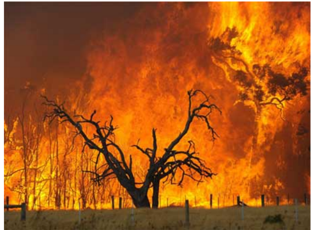
Trận cháy rừng tồi tệ nhất lịch sử ở Australia

09/02/2009 (Trận cháy tại Victoria ngày7/02/09) ( Cháy)