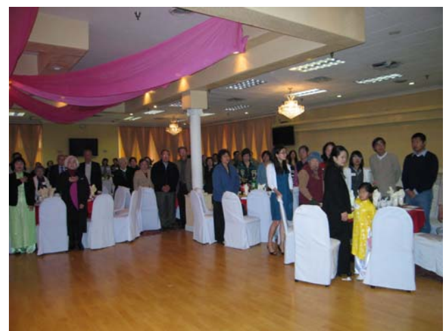
Quang cảnh nhà hàng trong lúc chào cờ VNCH