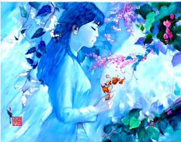
'Nhặt cánh hoa rơi chẳng thấy buồn'

Tháng 8 năm 2008 Chiêu Anh (Loài hoa không tên)