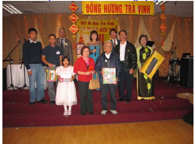
Đầu năm phát tài trúng số

Thảo Ốc An Cư Tích Kim Quang Đắc Đữ Bổ Y Tùy Phận Cầu Phúc Đắc Lại Tài