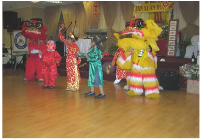
Lân - Địa - Táo chúc mừng Xuân mới