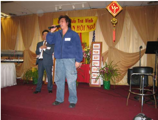
Đại Diện BTC chúc Tết bằng Hoa ngữ