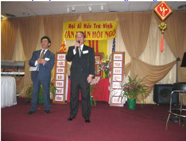
Chúc Tết bằng Miên ngữ