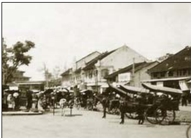
Bến xe Thố Mố” ngày xưa tại Sài Gòn

Trích “Làng cũ, Người xưa” của Tiền Vĩnh Lạc