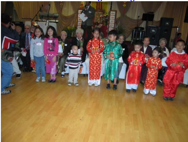
Các Thiếu Nhi nhận lì xì