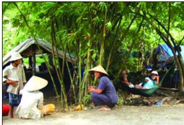
Nơi ăn, ngủ, nghỉ ngơi và sinh hoạt của những thợ lúa tứ phương

nhân công theo mùa đó đã giải quyết dù chỉ trong một phần nào tình trạng thất nghiệp của nhà nông, nhưng nó còn sanh ra được một sự giao lưu văn hóa đầy tình người, không đóng kín làng xã như nhiều miền khác, như thế tức là hình thành được một giống người cởi mở rộng rãi, không hẹp hòi đầu óc cũng như tâm lòng. Ngoài ra chính trào lưu nhân công đó đã là một nét đặc thù văn hóa miền Nam mà nó còn là một yếu tố bộc lộ hay xác nhận và chuyên chở bao nhiêu nét đặc thù khác nữa, mà câu chuyện duyên nợ của bác ba Huỳnh bá Phước của tôi là một.