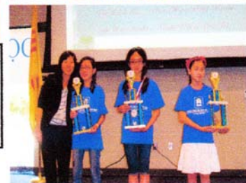
Giải Nhất Đố Vui Để Học Tiểu Học 1 & Tiểu Học 5 Giải Khuyến Học Kỳ XXII, Hè 2010