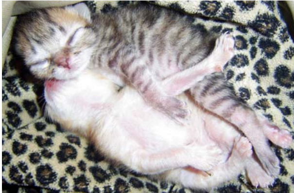
Hai mèo con chưa mở mắt