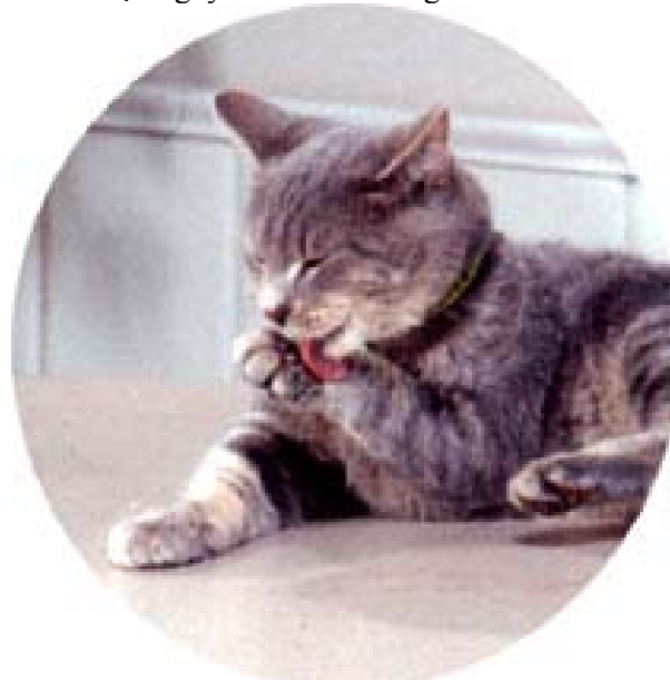
Chú mèo tự làm sạch sẽ