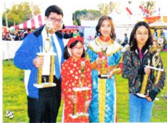
Học sinh TTVHVN đoạt 3 giải Nhất trong 4 giải thi vào kỳ Thi Chính Tả đầu tháng 1, 2010.