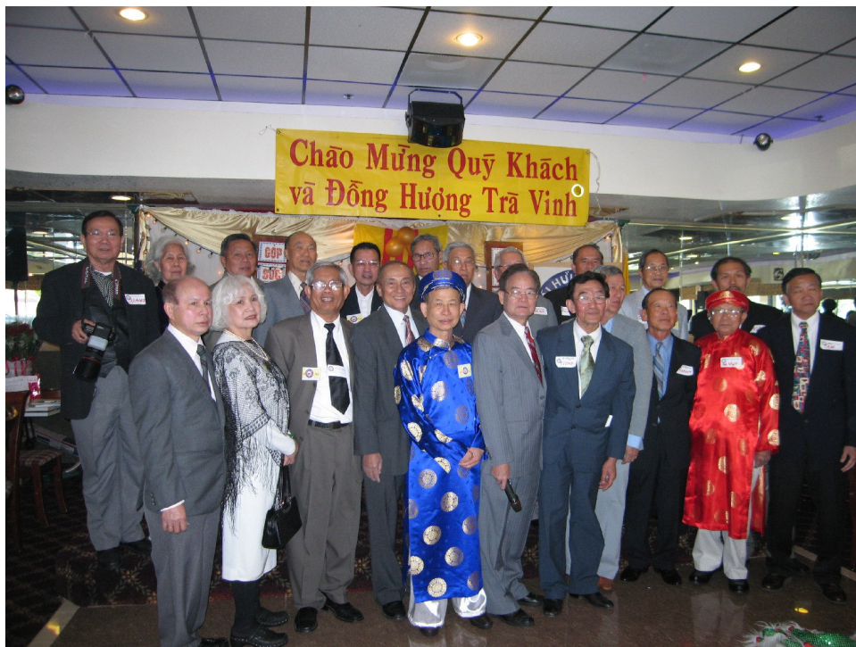
Ban Chấp Hành đương nhiệm của Hội Trà Vinh