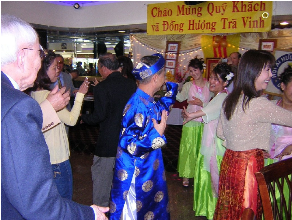
Điệu vũ Lâm Thôn được nhiều người tham gia